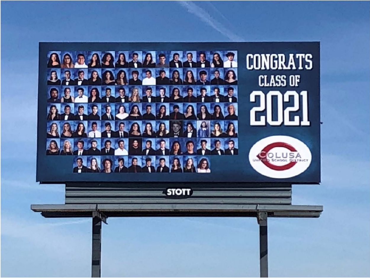
North side of Hwy 20, 1200' west of Niagra

On behalf of the Colusa Unified School District and Board of Trustees, we would like to congratulate the Senior Class of 2021!